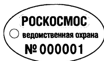
Рисунок. Жетон работника подразделения организации ведомственной охраны Государственной корпорации по космической деятельности "Роскосмос"

4. На одной стороне жетона по длине штампуются надпись, состоящая из слов, расположенных последовательно сверху вниз: слова "РОСКОСМОС", "ведомственная охрана", номер жетона (шесть знаков в порядковом исчислении, начиная с 000001).